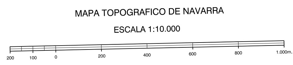
MAPA TOPOGRAFICO DE NAVARRA ESCALA 1:10.000

INFORMACION COMPLEMENTARIA ESCALA DE VUELO: 1:30.000 FECHA: OCTUBRE 1.995 REALIZACION: ADMUT S.A. RESTITUCION: OAP, BCL Y S02000 FECHA: JUNIO 1.996 PUBLICACION: OPTONICS FECHA: ENERO 1.996 REALIZACION: TRABAJOS CATASTRALES S.A.