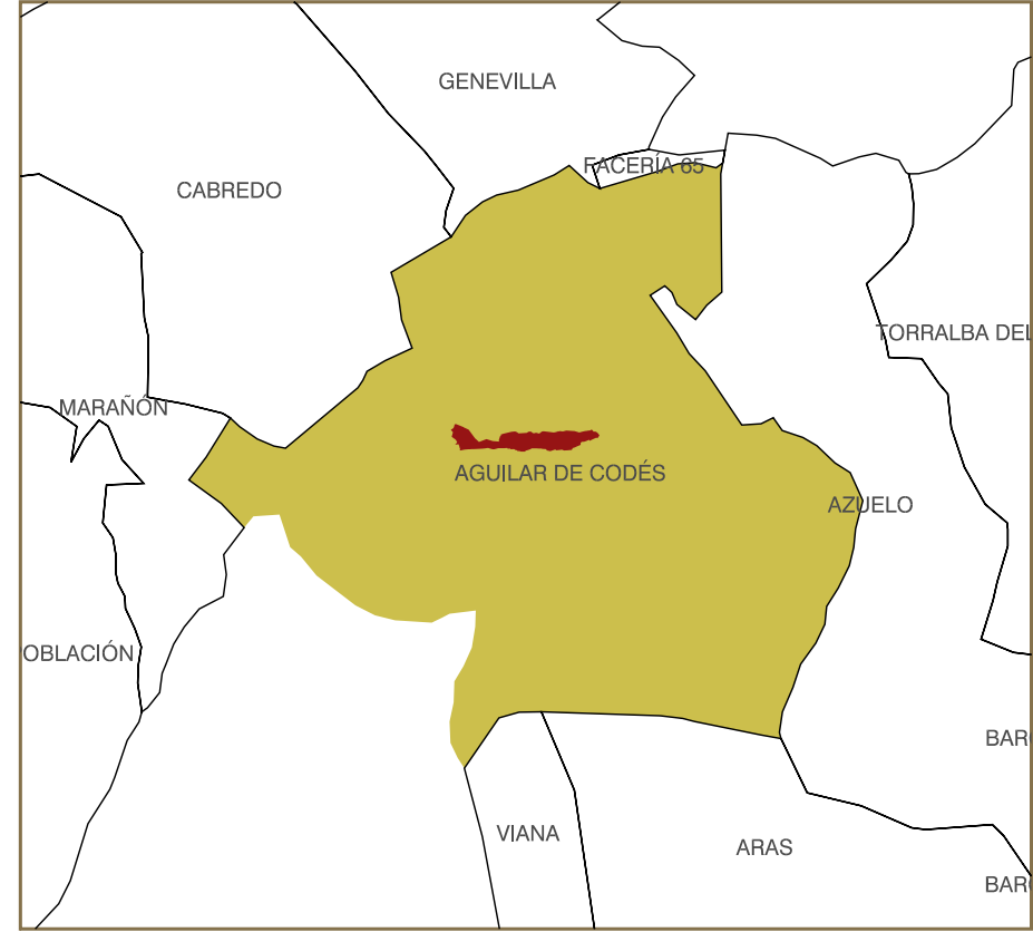
DISTRIBUCIÓN DE HOJAS