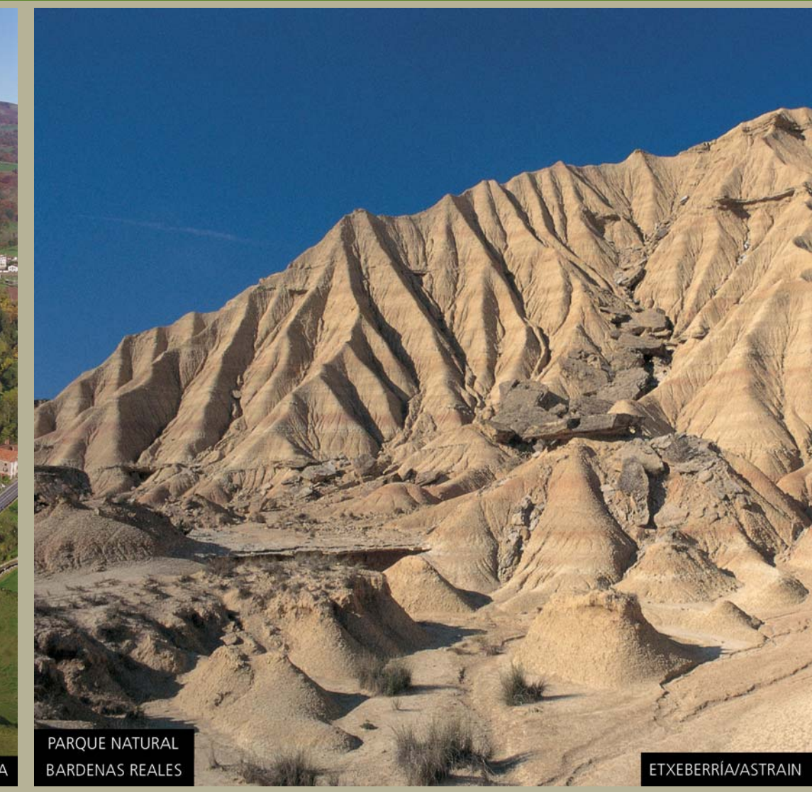
PARQUE NATURAL BARDENAS REALES ETXEBERRIA/ASTRAIN