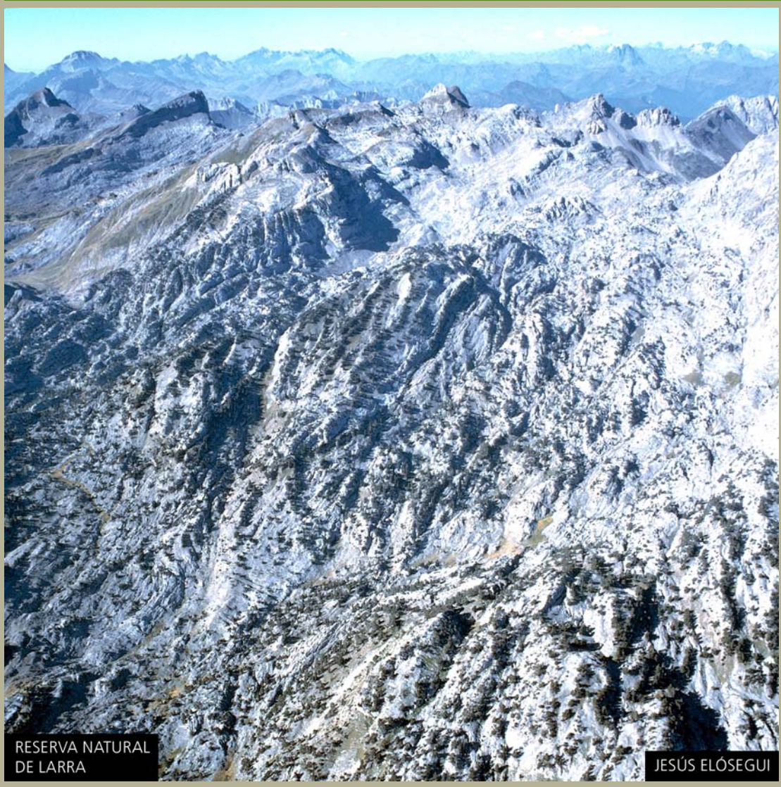
RESERVA NATURAL DE LAIRRA JESÚS ELÓSEGUI