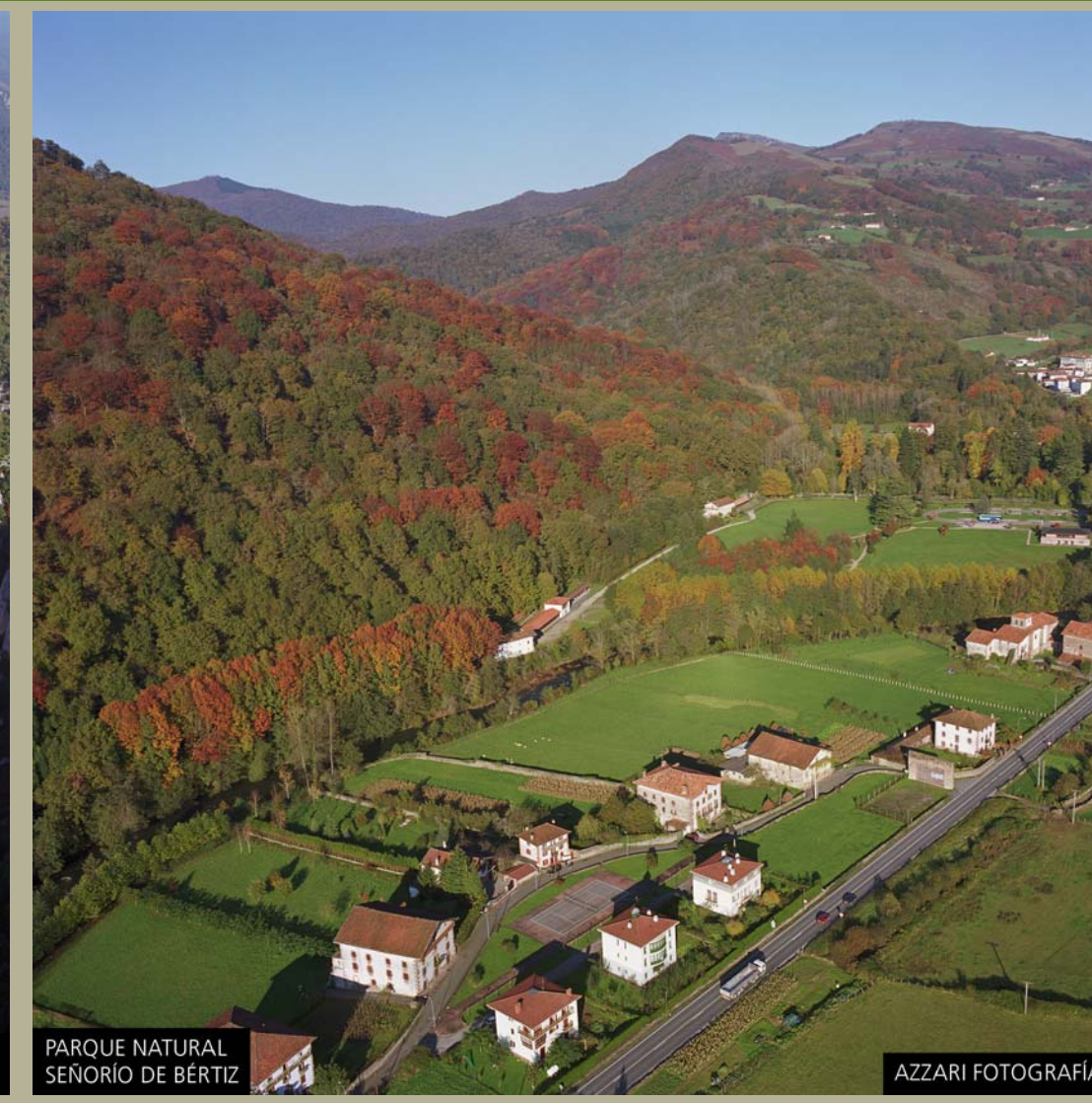
PARQUE NATURAL SEÑORIO DE BERTIZ