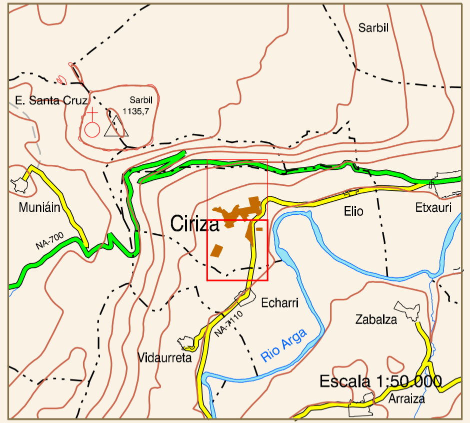
DISTRIBUCIÓN DE HOJAS