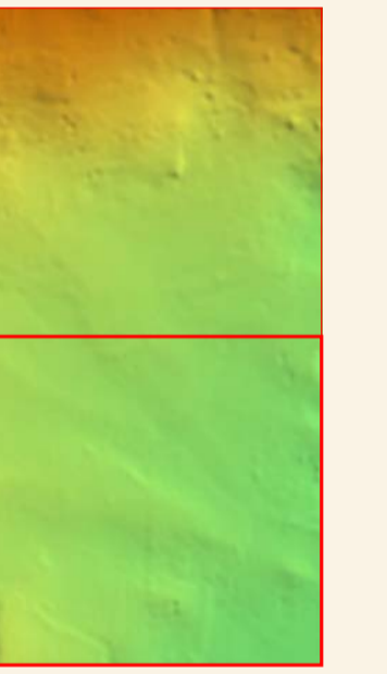
Altitud (m.) Mín. 393 Máj. 562 Escala 1:20.000